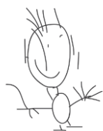
Association AEVE Autisme Espoir Vers l'Ecole